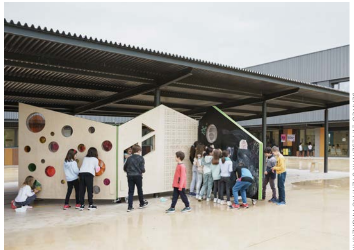
BLANCO ETA ESLAVAK UTZITAKO ARGAZKIAK

“Patioak berdetzeko eta naturalizatzeko prozesuetan esaterako garai interesgarriak bizi ditugu, aitzindarien garaia, asko dagoelako egiteko”.